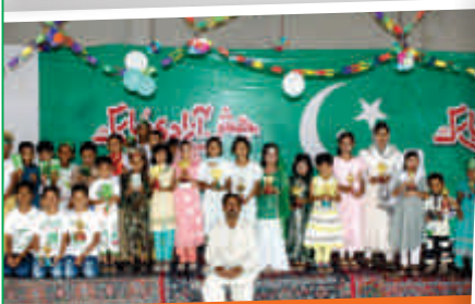
Independence Day celebrated at Imam Din Tameer-e-Millat School, Mian Channu