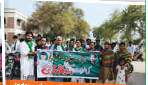
Independence day rally in Munir Arshad Memorial TM Multan School, Multan