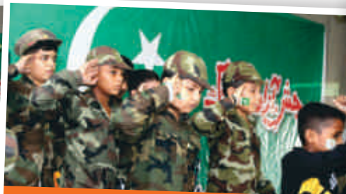
Independence Day celebrated at Imam Din Tameer-e-Millat School, Mian Channu