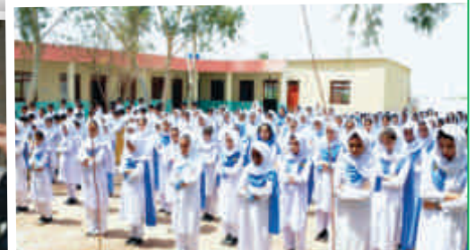
A view of Maria Helena TM School, Pind Dadan Khan after restructuring