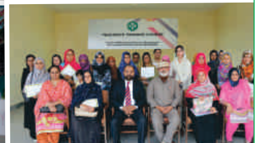
Teachers Training Course - 2 Held at Tameer-e-Millat City of Education, Fateh Jang