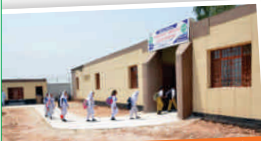
A view of Maria Helena TM School, Pind Dadan Khan after restructuring