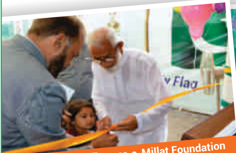
Inauguration of Tameer-e-Millat Foundation School, Kala Gujran, Jhelum