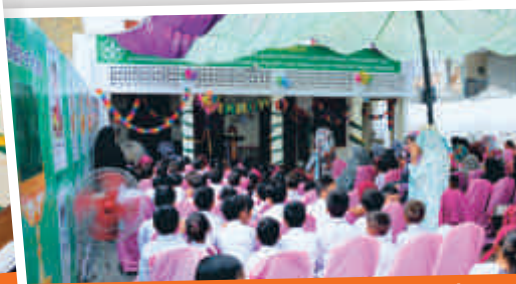
Inauguration of Tameer-e-Millat Foundation School, Kala Gujran, Jhelum