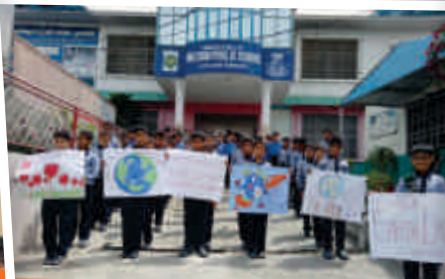
Earth Day celebrated at TM Hazara School, Shinkhari